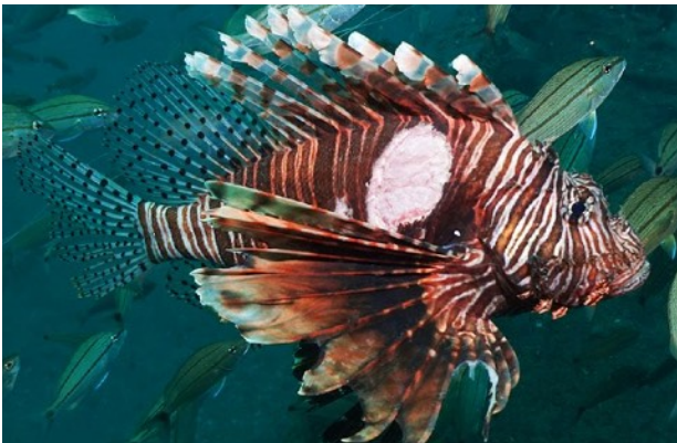
De huidaandoening werd voor het eerst gemeld in augustus 2017

Populaties van invasieve lionfish (koraalduivel) in de westelijke Atlantische Oceaan zijn dramatisch geruimd door de verspreiding van een nieuwe ziekte, maar het zal de invasie niet stoppen, volgens recent gepubliceerd onderzoek van wetenschappers aan de Universiteit van Florida.