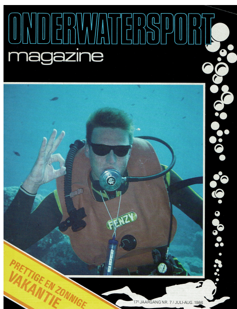
lokatie: Het Tegelwrak bij Porto Vecchio, Corsica)