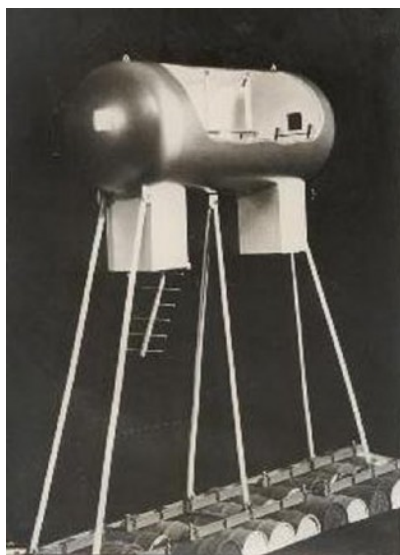
(schaalmodel: Jan de Rooij)

LPG-tank / lengte 4,50 m / diameter 1,60 m / gewicht 14,4 ton / gewicht onderwater 8,4 ton / met 6 stalen stangen aan het ballastpakket / ballastpakket 30 vaten van 200 liter rest-beton / vaten onderling verbonden met balken van H-profiel / hard van de tank ca. 10 m / bodem ter plekken ca. 15 meter.